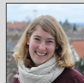
Amrei Bosch Posaunenchor