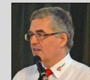
Hans-Ulrich Frey Partnerschaft Kakuri