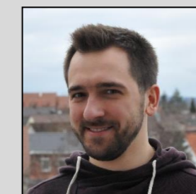
Matthias Bosch Apricot