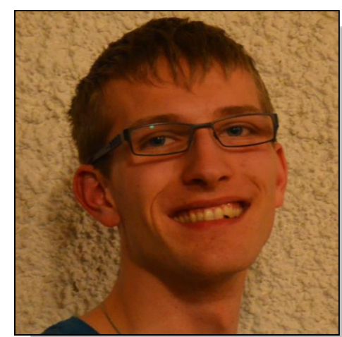
Tim Burgel Haus (V) Technik