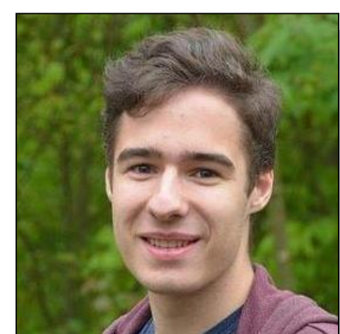
Lucas Haug Technik (V) Ziele/Zukunft