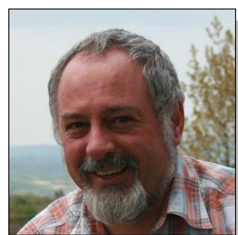
Kurt Schmauder Junge Erwachsene Familienarbeit Kooperation Schulen Mitarbeiterschulung Kakuri Sport