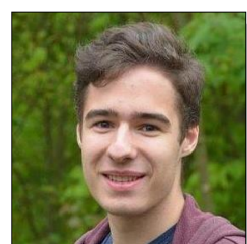
Lucas Haug Technik (V) Ziele/Zukunft