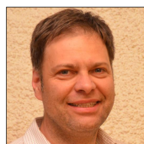
Guido Lamm Haus Technik